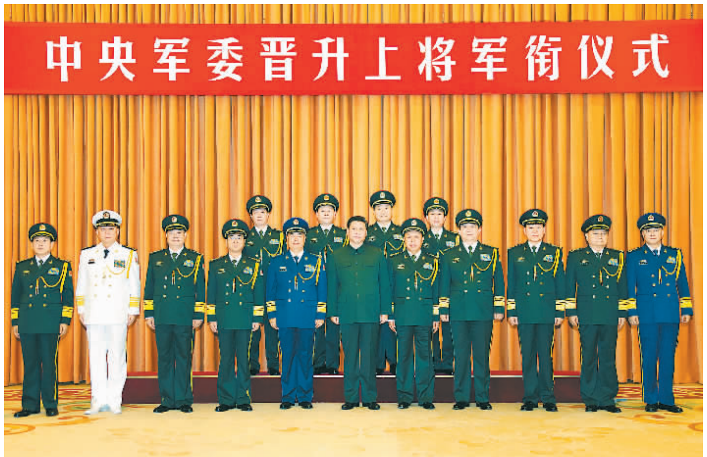
7月11日,中央军委在北京八一大楼隆重举行晋升上将军衔仪式。中央军委主席习近平向晋升上将军衔的军官颁发命令状。这是仪式结束后,习近平等领导同志同晋升上将军衔的军官合影留念。

新华社北京7月11日电 (记者曹智) 中央军委11日在北京八一大楼隆重举行晋升上将军衔仪式。中央军委主席习近平向晋升上将军衔的军官颁发命令状。 下午3时,晋升仪式在庄严的国歌声中开始。中央军委副主席范长龙宣读了6月30日中央军委主席习近平签署的晋升上将军衔命令。中央军委副主席许其亮主持晋衔仪式。