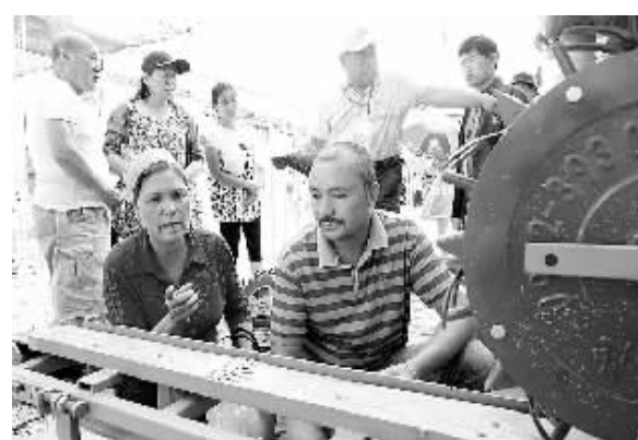
7月9日，2014年中哈霍尔果斯国际边境合作中心机电产品博览会开幕，本次展会共有50余家知名机电企业参展。图为一家企业的新型播种机受到客商的关注。

医疗器械“五整治”专项行动期间，总局针对案件易发的重点领域、重点环节、重点品种，严打制假售假违法行为，严惩发布严重违法广告生产经营企业，及时移送、公开曝光，保持了高压震慑态势，取得了阶段性成效。