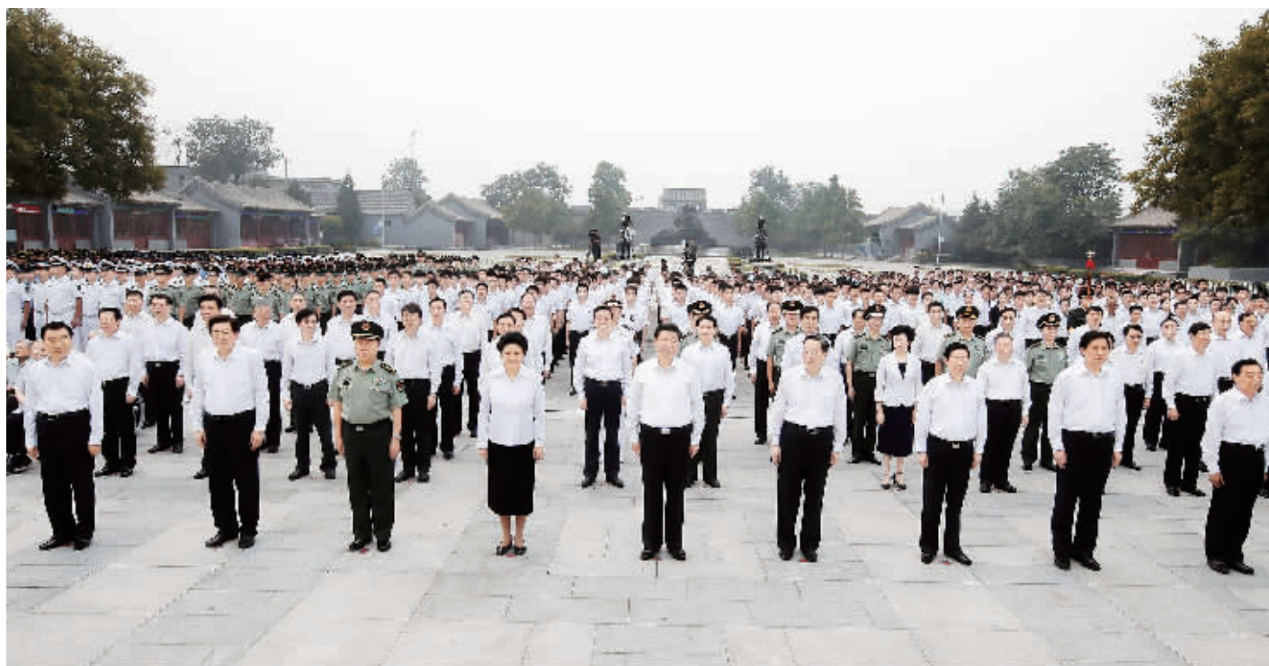
7月7日,首都各界在中国人民抗日战争纪念馆隆重集会,纪念全民族抗战爆发77周年。中共中央总书记、国家主席、中央军委主席习近平出席纪念仪式并发表重要讲话。