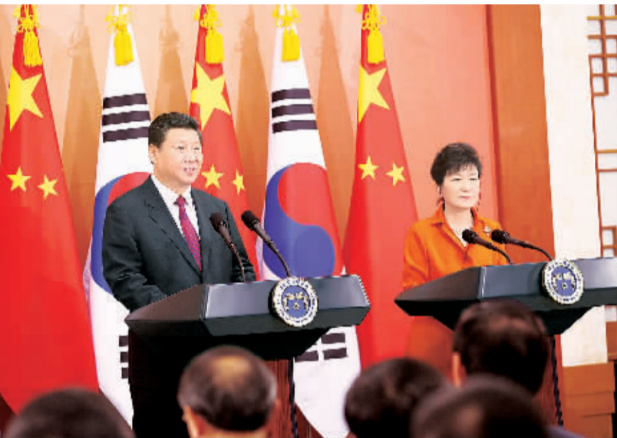
7月3日,国家主席习近平在首尔同韩国总统朴槿惠举行会谈。会谈后,两国元首共同会见记者。新华社记者 姚大伟摄

第三,做活人文交流。用好两国人文交流共同委员会机制,2015年和2016年互办旅游年,实现2016年两国人员往来1000万人次目标,为此,双方可以采取公务护照互免签证、普通护照短期旅行免签等便利化措施。加强青年交流,2015年起5年内中方每年增加邀请100名韩国青年精英访华。中方支