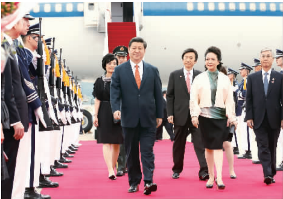
7月3日,国家主席习近平抵达首尔,开始对韩国进行国事访问。这是韩国礼兵沿着红地毯两侧列队,向习近平和夫人彭丽媛行注目礼。

两国元首一致决定中韩作实现共同发展的伙伴、致力地区和平的伙伴、携手振兴亚洲的伙伴、促进世界繁荣的伙伴