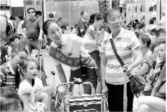
7月1日,北京南站客运员热情服务候车旅客。当日零时起,全国铁路实行新的列车运行图,这是自2007年以来铁路最大幅度的一次调图,2014年暑运也由当日起拉开大幕。

对此,东方证券首席投资顾问阮军认为,中国石化如果拿出3成的比例进行改革,将对市场产生较大吸引力。“中石化在油品销售方面一直处于垄断地位,民资或者游资始终难以介入。2013年中石化成品油销售总量占整个市场份额的60%,未来公司利润和销售的发展空间非常大。在这样大的份额之下能够引入30%的民资,对于市场来说,未来可能会吸引很多的民资进行关注和投入。”阮军说。