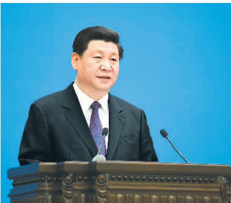
6月28日,国家主席习近平在北京人民大会堂出席和平共处五项原则发表60周年纪念大会并发表主旨讲话。

新华社北京6月28日电(记者钱彤 郝亚琳) 和平共处五项原则发表60周年纪念大会28日在人民大会堂隆重举行。国家主席习近平出席大会并发表题为《弘扬和平共处五项原则 建设合作共赢美好世界》的主旨讲话,深刻阐述和平共处五项原则的历史性贡献和重大现实意义,强调中国将继续做和平共处五项原则的表率,同国际社会一道,推动建设新型国际关系和持久和平、共同繁荣的和谐世界。