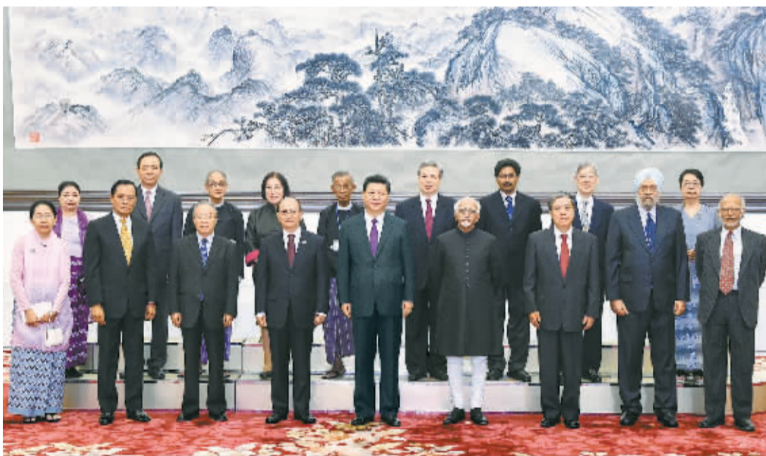
6月28日,国家主席习近平在北京人民大会堂出席和平共处五项原则发表60周年纪念大会并发表主旨讲话。图为习近平与缅甸总统吴登盛、印度副总统安萨里共同会见出席大会的中缅印三国部分代表。