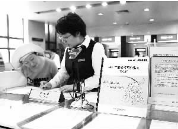
日前，中国工商银行北京分行网点已全部布放盲文版服务指南和助盲卡，为盲人客户提供更加细致、完善的金融服务。图为工行北京分行营业部的盲文版服务指南，以盲文和汉字对应的形式印刷。

世界自然基金会(中国)社会责任及可持续发展首席顾问、北京大学社会责任研究所首席顾问孙继荣认为，《报告》展现了中国银行业以“责任银行和谐发展”的理念为指导，在深化改革推进责任管理，开展负责任运营和促进经济社会环境可持续发展中取得的新的显著进展。同时，他希望银行业金融机构进一步认识与可持续发展相关的实质性主题，广泛深入地把社会责任融入银行的智力、管理和核心业务运营过程。