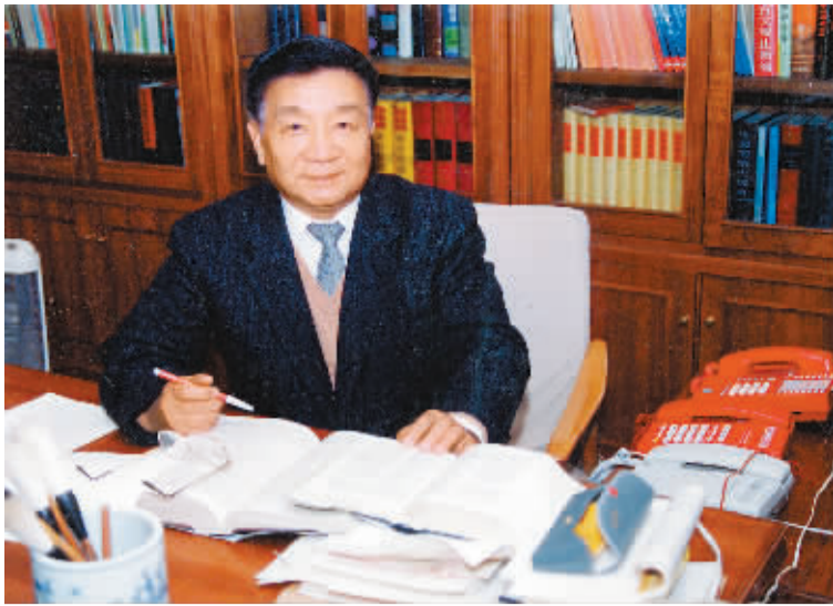
1993年11月,王文元同志在最高人民检察院办公室留影。