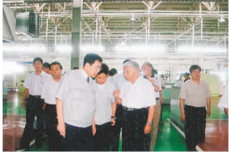
2008年,王文元同志(前右)在山东日照考察。