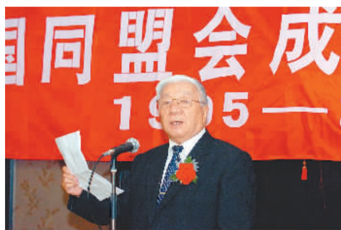
周年 林 摄