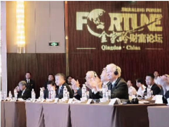
论坛吸引了众多重量级嘉宾。本报记者 潘笑天摄 (相关报道见四版)

参加会议的代表认为,青岛具有良好的实体经济基础、优美的自然环境和悠久的诚信文化,这是青岛建设财富管理中心城市的有利条件,希望金家岭财富论坛能持续举办下去,也希望青岛财富管理金融综合改革试验区探索创造出可供其他地区复制和借鉴的改革经验。