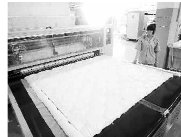
6月19日,喜临门北方生产基地工厂员工在操作缝纫机。近年来,河北香河县注重引进全国知名的家具生产企业进县落户,全力促进家具产业转型升级。

建立国际贸易“单一窗口”,是上海自由贸易试验区监管制度创新的具体举措。据统计,自本月初启动测试以来,企业通过“单一窗口”已成功申报一般贸易进口货物6票,海关、检验检疫、边检等办理船舶离港手续60艘次。另悉,上海国际贸易“单一窗口”将在7月份全面向企业推广应用,并逐步扩大“单一窗口”试点项目,实现货物申报由进口推广到出口、由海港推广到空港,办理船舶手续由放行扩展到申报等。