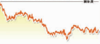
6月18日上证综指走势图

经济日报社出版 WWW.CE.CN 国内统一刊号CN11-0014 代号1-68