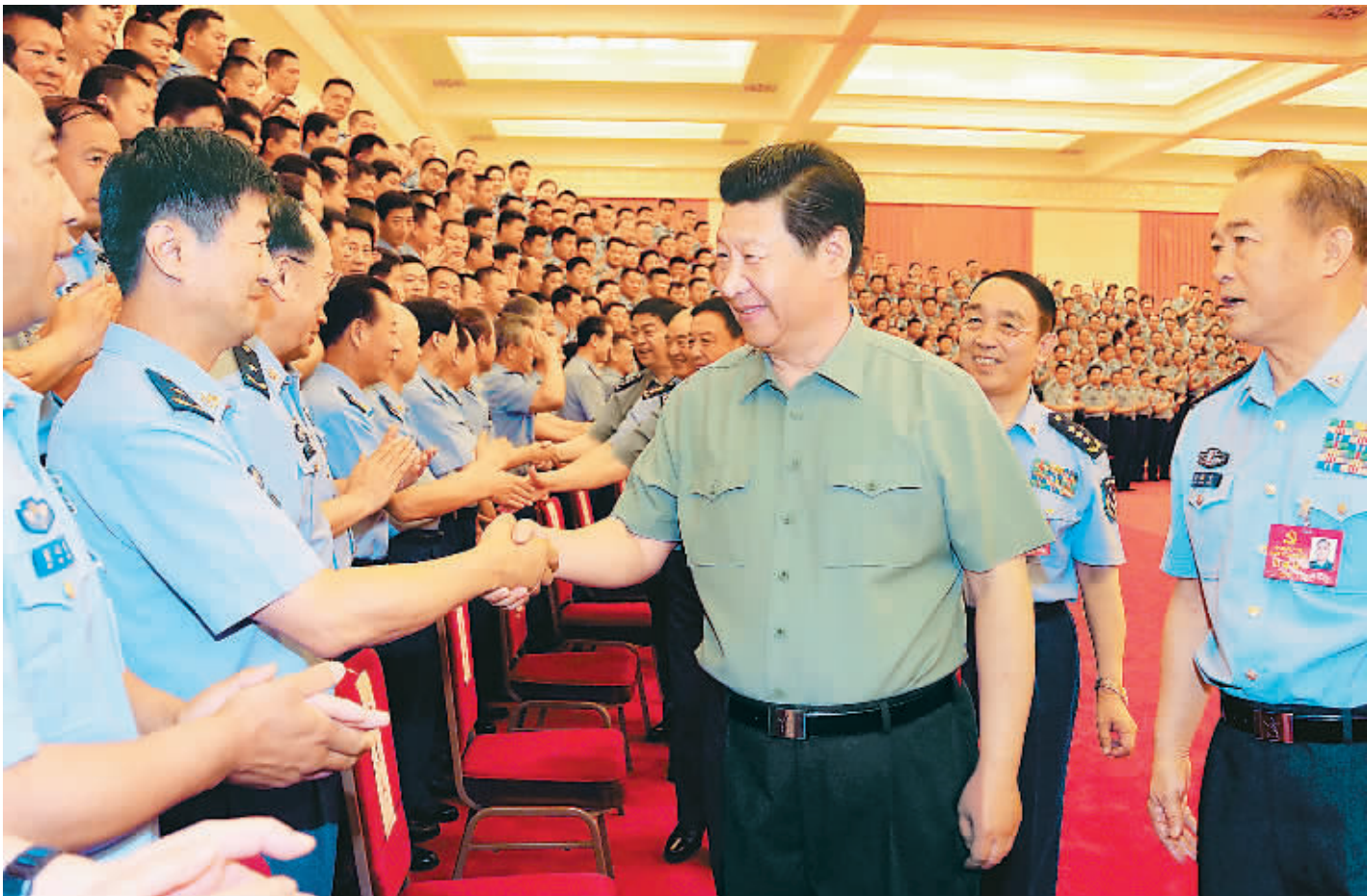
6月17日，中共中央总书记、国家主席、中央军委主席习近平在北京接见空军第十二次党代会代表。