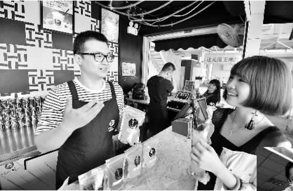
天津市南开区多措并举促进大学生创业就业显成效,天津大悦城“骑鹅公社”成为大学生创新创业示范基地。

上图 天津大悦城“骑鹅公社”大学生创业者实成在为顾客推荐新上市的“易普乐士”创意饮品。