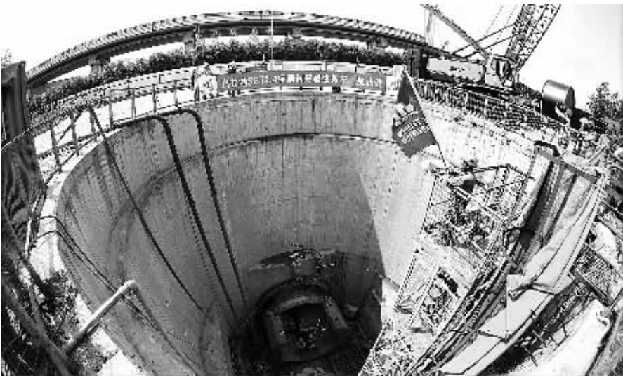
5月7日，在上海市污水治理白龙港片区南线输送干线完善工程施工现场，结合数字化系统的成功运用，直径4米、重达30多吨的钢筋混凝土污水管精确“穿越”磁浮列车桩基和浦东机场航油管。

造使用年限超过50年、材质落后和漏损严重的供排水管网；对存在事故隐患的供热、燃气、电力、通信等地下管线进行维修、更换和升级改造；推进城市电网、通信网架空线入地改造工程；实施城市宽带通信网络和有线电视网络光纤入户改造，加快有线电视网络数字化改造。 四是加强维修养护，消除安全隐患。建立地下管线巡护和隐患排查制度，制订应急防灾预案，切实提高事故防范、灾害防治和应急处置能力。要定期排查地下管线存在的隐患，制定工作计划，限期消除隐患。 五是开展普查工作，完善信息系统。组织开展地下管线普查工作，并在普查的基础上，建立完善地下管线管理信息系统，实现信息的即时交换、共建共享、动态更新。 六是完善法规标准，加大政策支持。研究制订地下空间管理、地下管线综合管理等方面法规，健全相关配套规章。开展各类地下管线标准规范的梳理和制（修）订工作，建立完善地下管线标准体系。加快城市建设投融资体制改革，鼓励社会资本参与城市基础设施投资和运营。鼓励应用先进技术，积极推广新工艺、新材料和新设备。 《意见》强调，要牢固树立正确的政绩观，纠正“重地上轻地下”、“重建设轻管理”、“重使用轻维护”等错误观念，加强对城市地下管线建设管理工作的组织领导。健全工作机制，加强联动协调。