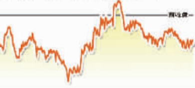
6月12日上证综指走势图