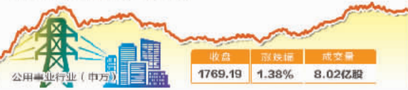
6月11日波动最大行业走势图

世界银行下调今年全球经济增长预期 世界银行10日发布最新一期《全球经济展望》报告 报告预测,2014年全球经济增长为2.8%,低于去年1月 预测的3.2%,但高于2013年2.4%的增速