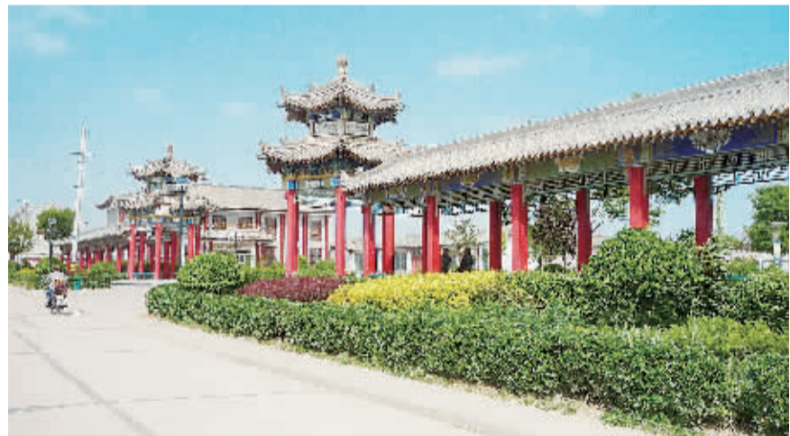
图为龙马村中心广场。

2007 年以来,龙马村抓住新农村建设的机遇,坚持生态美村的发展思路,实施退耕还林还草、生态园林建设、环卫设施建设等工程。在老村基础上,建设新