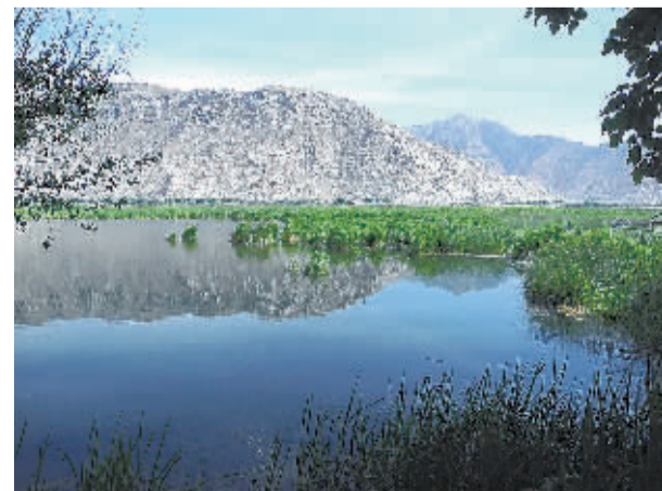
西藏自治区环保厅、拉萨市日前举办了清扫拉萨湿地的活动。拉萨湿地被称为“拉萨之肺”,是世界海拔最高、面积最大的城市天然湿地,也是中国唯一的城市内陆天然湿地。图为拉萨湿地一景。

海口市出台《企业信用分类监管暂行办法》,按诚信守法经营的不同情况,将市场主体划分为良好守信、一般守信、轻微失信、严重失信 4 个监管类别。根据办法,所有分类监管信息每季度通过信息公示平台向社会公开公示。办法不仅对失信企业规定了相关处罚和约束制度,还对良好守信企业提供重点扶持,其企业名称权、注册商标及其相关权益受工商部门重点保护等服务措施。海口市工商局局长邢帆说,今后,海口将逐步建立并完善企业信用监管数据规范和标准体系,建立守信企业激励机制、警示企业预警机制、失信企业惩戒机制和严重失信企业淘汰机制。