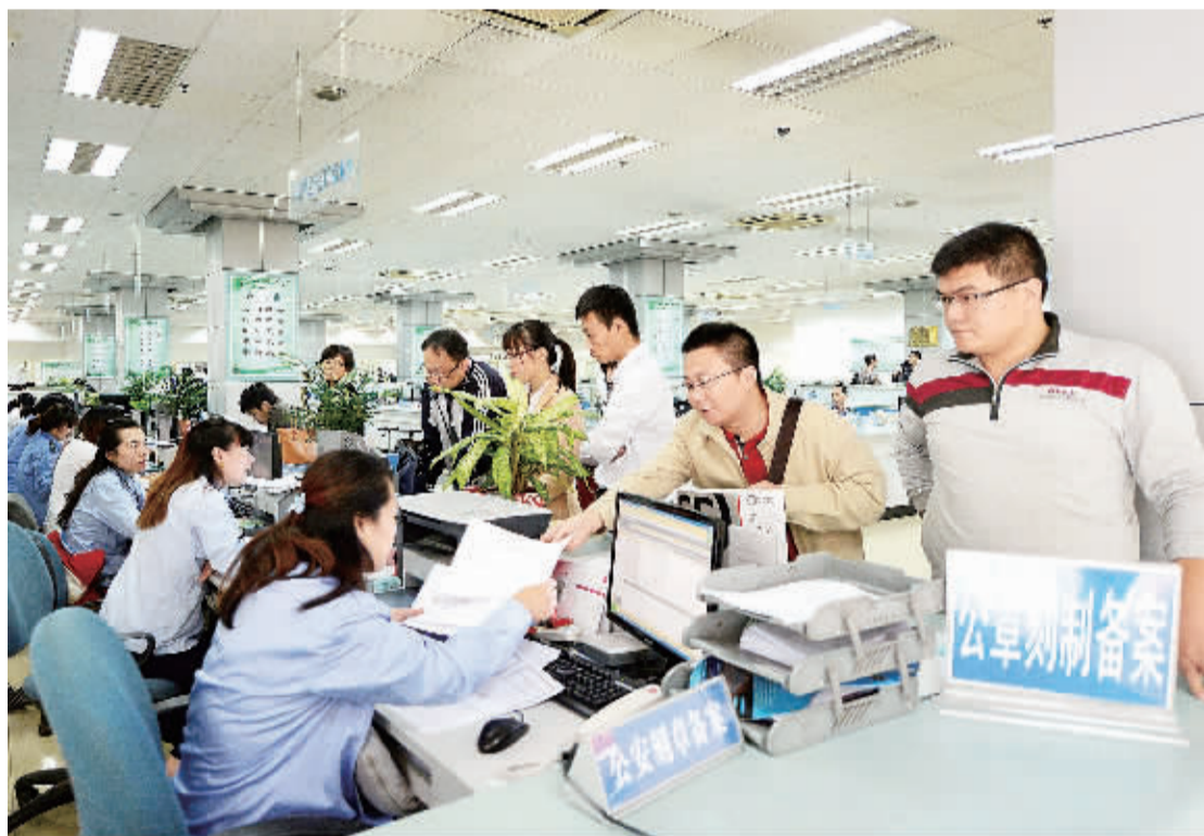
在山东济南政务服务中心,市民正在办理公章刻制备案业务。近年来,济南市深化行政审批制度改革,创新建设项目和企业设立两大关键领域审批新模式,为经济社会发展注入新活力。

据悉,目前园区管理采取单一的以政府管理为主的模式,管理人员不专业,导致资源不能得到合理有效配置、集聚效应不强,亟需进一步理顺园区管委会与市场、企业的关系,把资源配置的事交给市场,把生产经营权交给企业,把社会服务的事交给社会组织和中介机构。对此,甘肃省决定,今年要在国家循环化改造示范试点的园区中探索建立以企业为主的园区管理体制,探索建立由政府、企业、金融机构等共同参与的多元管理体制。