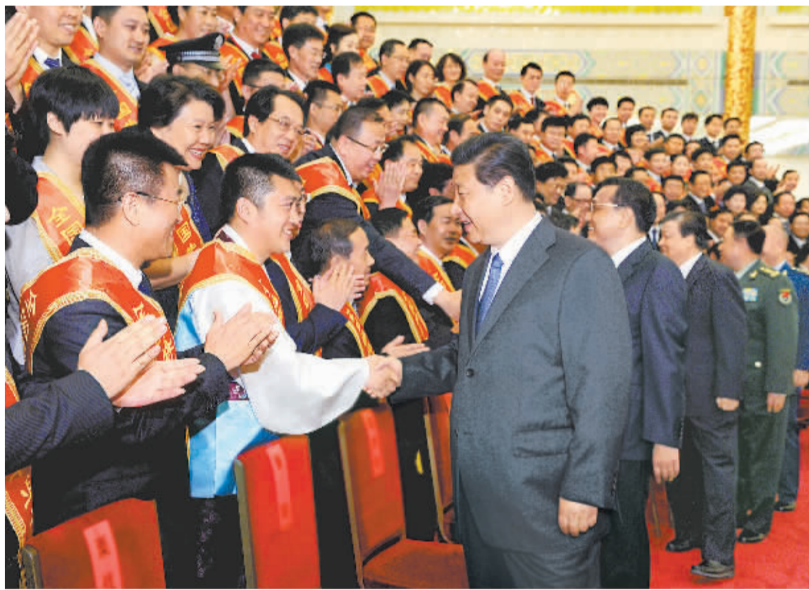
会第六次全国军转表彰大会受表彰代表