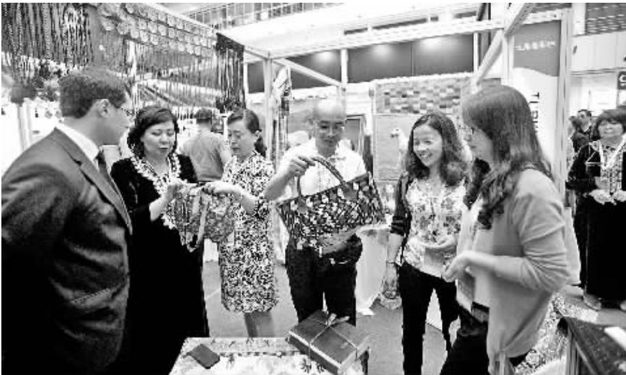
上客商前来参会洽谈。 为了更好地体现大会主题，此次西洽会重点设置了丝绸之路国际博览会国际馆、丝绸之路经济带沿线国家和地区旅游文化站、丝绸之路经济带沿线国家和地区特色产业精品展等围绕共建丝路经济带

本届展会展览展示面积达到30万平方米，为历年之最。共有31个省区市和新疆生产建设兵团参会，28个省区市和新疆生产建设兵团参展，有16个国家以国家名义设立国家馆，预计将有10万以