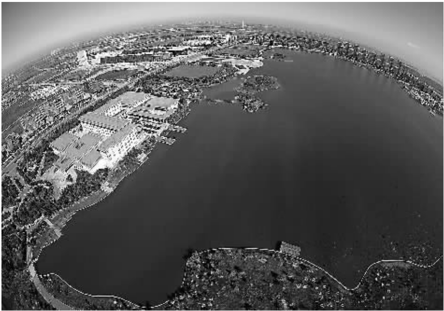
天津高新区渤龙湖航拍图。

连续12年单位GDP能耗平均下降6.5%——这一骄人的成绩见证了天津高新区在绿色发展道路上的不懈努力。2012