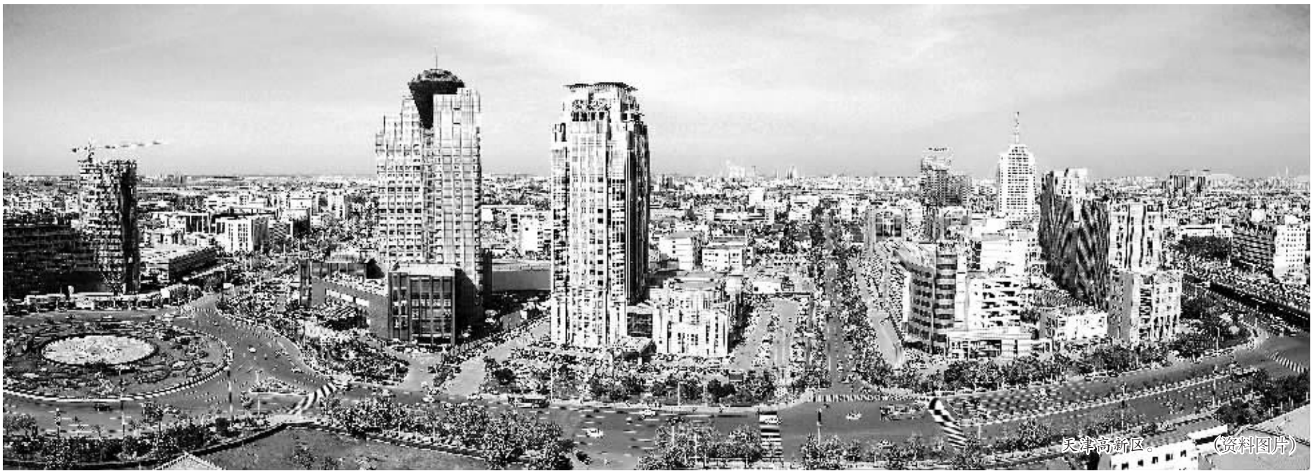
天津高新区。(资料图片)

作为首批国家级高新技术产业开发区,20多年来,天津高新区一直保持着年均增速30%以上的高速发展。2013年,这片创新的热土上聚集企业超万家,实现总收入9039亿元;实现生产总值1533亿元,有效专利数12020件,万人发明专利拥有量居国家高新区首位。