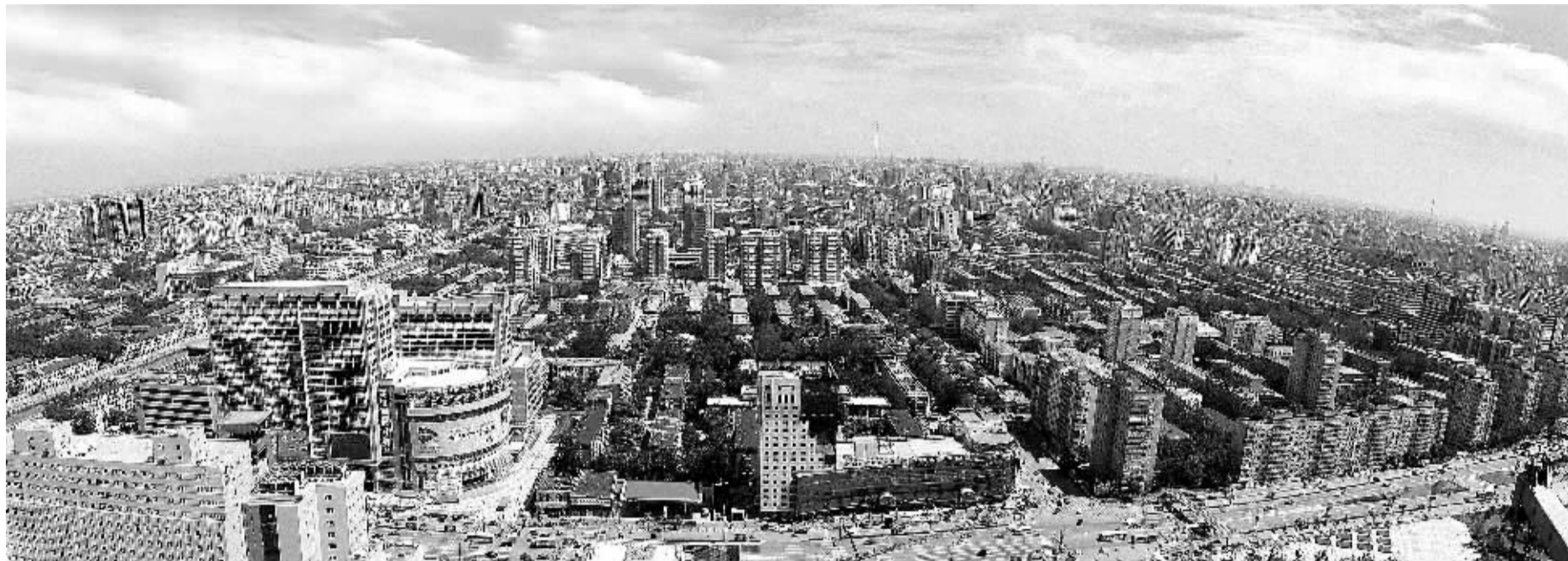
中关村国家自主创新示范区一景。(资料图片)

“硅谷唯一的竞争对手”——有着百年历史的权威科技媒体《麻省理工科技评论》这样评价北京。而对北京市经济增长贡献率达25%、创业投资金额和案例数约占全国三分之一的中关村国家自主创新示范区，无疑是中国“硅谷”最核心的地标。2013年，是中关村在世界创新舞台上愈加出彩的一年。这一年，中关村实现出口总额336.2亿美元，同比增长28.5%；为中国创新赢得话语权的国际标准首次破百，达130项；成功获得有“全球科技园奥运会”之称的2015年世界科技园协会(IASP)年会举办权；在加拿大渥太华设立国际孵化中心；出台中关村国际化发展行动计划；绘制全球领先技术团队分布图……中关村之国际化势不可挡。