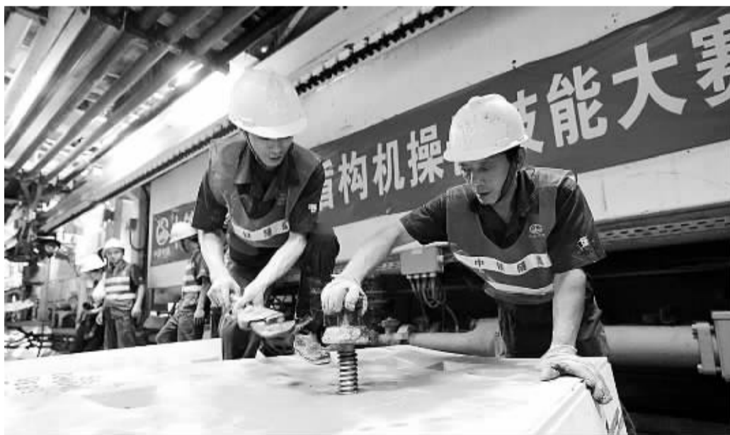
5月8日，在深圳地铁11号线车红区间项目工区，中铁隧道集团盾构司机参加技能大赛，为工程顺利完工进行技术练兵。据介绍，正在施工的深圳地铁11号线是目前国内一次建成线路最长、时速最快的城市轨道交通项目，预计今年年底实现全线贯通。

据高交会组委会主任、深圳市市长许勤介绍，本届高交会共设置高新技术成果交易、高新技术专业产品展、中国高新技术论坛、super-SUPER专题活动、高新技术人才与智力交流会、不落幕的交易会等6大板块，预计展区总面积超过11万平方米。高交会组委会副主任兼秘书长、深圳市副市长陈彪表示，本届高交会最大特点是突出“创新”和“绿色”两大关键词。