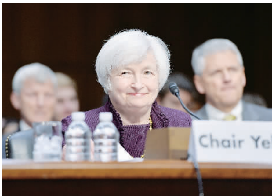
5月7日,在美国首都华盛顿,美国联邦储备委员会主席耶伦在国会联合经济委员会作证。耶伦表示,美国经济增长预计将在今年提速,但房地产、就业疲软以及持续低通胀为复苏前景增添了风险,美联储将继续维持宽松的货币政策助力复苏。