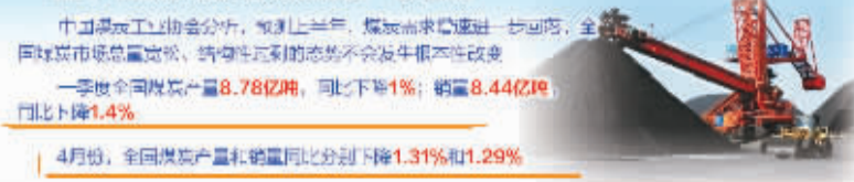
上半年煤炭需求增速预计进一步回落