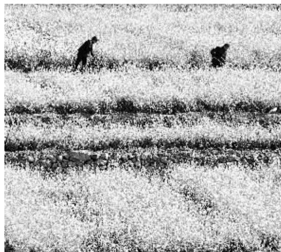
5月4日，山东省淄博市沂源县悦庄镇上枝村的农民在进行田间管理。

2014年，国家卫生计生委将完善各种形式的重大疾病医疗保障机制，继续推进22种重大疾病保障工作，将城乡居民大病保险工作推广到50%以上的新农合统筹地区。