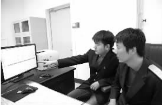
为确保“4·21”哈大、盘营高铁夏季运行图顺利实施，大连火车站做好前期准备，对列车占线等信息反复核对。图为工作人员正核对列车运行计划。本报记者苏大鹏 通讯员郭伟摄影报道

来凤是湖北“西大门”，龙山是湖南“窗口县”，同处武陵山腹地，均是国家级贫困县。近年来，变化生动地写在了酉水河两岸。以前，龙山县城市建设向南延伸，来凤的县城向北发展，中间是空旷的田野。今天，桥南桥北已经宛若一个城市。“一水、双城、三区、四片、多组团”的城市对接