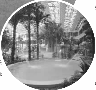
宾县英杰温泉景区。

“春赏百花秋望月，夏避暑清冬弄雪”。这是黑龙江省宾县“英杰风景区”的最新写照。作为本山传媒影视基地之一，这里随着《乡村爱情》等剧的热播名扬省内外。你难以想象，三年前这里还是一番潦倒景象。两山夹一沟，滂沱大雨经常冲毁农地，十年九不收。山地破皮便成砖石瓦块，产量不足正常亩产的1/3。村民一亩地收入500到1000元，家家一贫如洗，70多户村民还居住着泥草房。