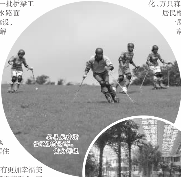
宾县龙球村雪场夏季滑雪。

发展的目的在于改善民生，在于让人民群众拥有更加幸福美好的生活。实践证明，只要心里装着群众，凡事想着群众，工作依靠群众，一切为了群众，群众工作就一定能够出现新的局面、取得新的成效，也就一定能够实现好、维护好、发展好群众的根本利益。“百桥工程”的建成通车像一把进军的号角，召唤着宾县朝着更高更远的目标奋进。