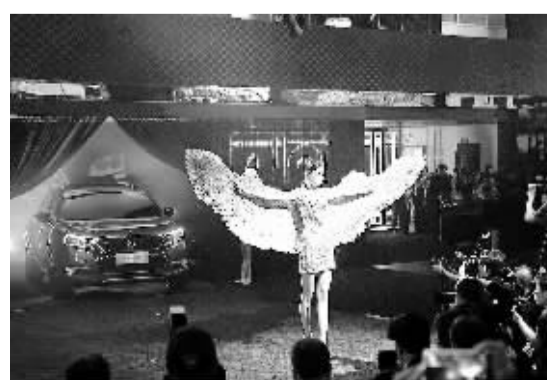
4月20日,来自巴黎的新世代豪华汽车品牌DS 6WR全球首发。该车是DS品牌倾力打造的首款豪华SUV车型,不仅拥有丰富创新技术内涵,其外形设计风格也吸收了概念车Wild Rubis(野性红宝石)的设计元素。

台上一分钟,台下十年功。自主品牌车今天能拿出那么多优秀成果在北京国际车展上奉献给观众,背后是过去10多年来在自主创新道路上的不懈拼搏和坚守,是对质量和技术改进孜孜不倦的追求。在自主品牌车产品力不断提升的过程中,我们有充足的信心:下一个展会,自主品牌车能给我们带来更多的惊喜。