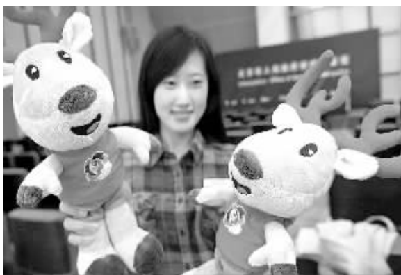
4月22日，工作人员在发布会现场展示世界月季洲际大会吉祥物。当日，2016年世界月季洲际大会标识和吉祥物在京正式发布。标识为月季花组成的“花绘北京”图案，吉祥物为麋鹿。

南京海关副关长钱英培告诉记者，该案呈现出犯罪主体智能化、专业化程度高、犯罪手段隐蔽性、欺骗性强，犯罪链条复杂化、团伙化趋势明显的特点。“与偷税漏税相比，骗取出口退税的社会危害性更大，不仅造成了国家财政资金的巨额流失，还扰乱了正常的市场秩序，削弱了国家宏观调控的能力。”钱英培说。