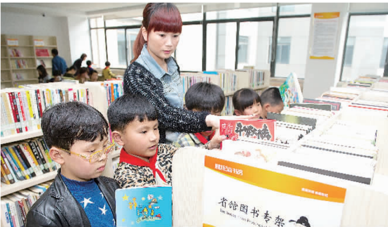
4月22日,小读者在安徽省图书馆合肥滨湖世纪社区分馆选书阅读。4月23日是第19个世界读书日(世界图书与版权日)。最新发布的第一次全国国民阅读调查数据显示,2013年国民人均纸质图书阅读量为4.77本。

更多报道详见七版—— 让农村金融活水长流 “定向降准”释放积极信号 引导信贷资金为“三农”输血