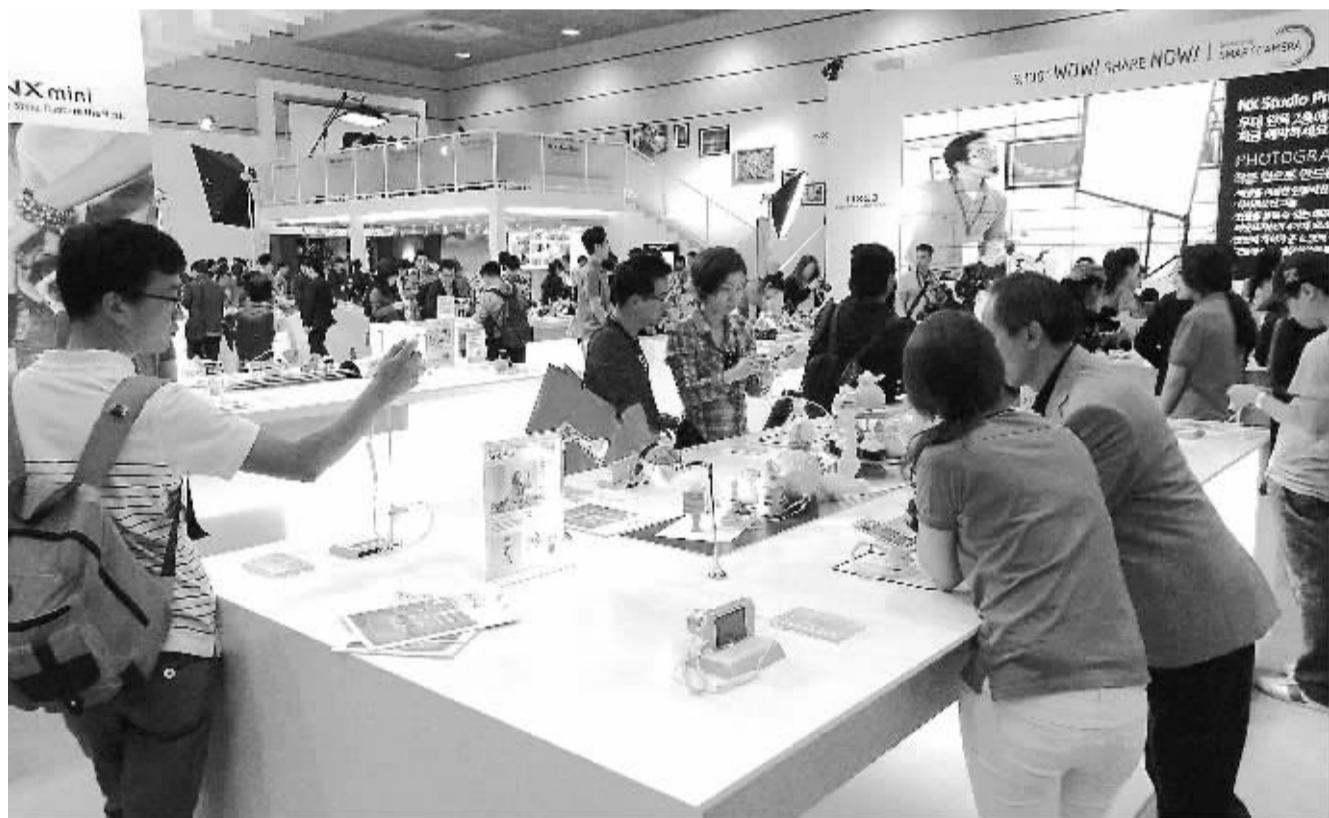
“2014首尔国际摄影摄像器材展”日前在首尔会展中心举行,包括佳能、尼康、索尼、三星电子等在内的共151个相关企业,在展会中展示了搭载最新数码技术的相机、镜头、摄像机、打印机、应用器材等摄影摄像产品。

从尽力获得亚运会主办权到不得已主动放弃,看似是兜了一圈又回到原点,但其实经过此事,越南已经站在了更高的起点上。阮晋勇17日宣布放弃亚运会主办权后,越南国内舆论普遍表示欢迎和赞扬。一个国家主办大型国际赛事往往能够展示和提升自身形象,但正如阮晋勇所说,“如果组织不成功,将会适得其反”。越南此前就主办方案广泛征求社会各界和民众意见,其中约80%的民众表示不支持主办亚运会。经反复权衡,越南最终放弃亚运会主办权,尽管此举看起来有些被动,是不得已而为之,但这种实事求是和果敢的态度、避免“打肿脸充胖子”和“不惜一切代价”的做法,反倒为越南政府赢得了“面子”和国内的好声。