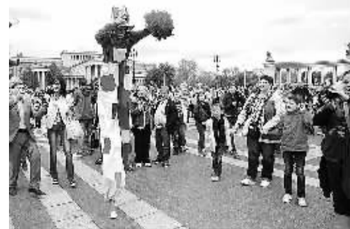
4月19日,在匈牙利首都布达佩斯的英雄广场,布达佩斯大马戏团的小丑参加游行活动,庆祝世界马戏日。

据悉,印尼万自立银行(MANDIRI)认为,使用人民币作为支付工具可以最大限度减少外汇风险,减少套期保值的需要,节省成本。印尼亚洲中央银行(BCA)则在2008年率先推出人民币汇款服务,2009年推出人民币贸易,2011年推出人民币转账服务及人民币存款服务。