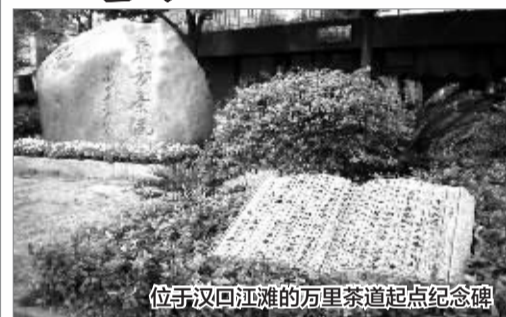
位于汉口江滩的万里茶道起点纪念碑