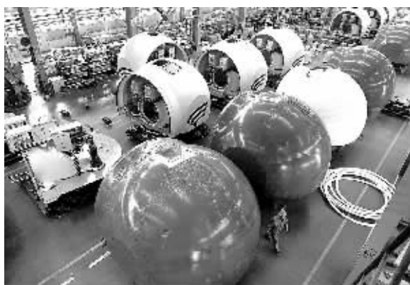
这是河北金凤电控设备有限公司的风力发电机组机舱组装车间。近年来,河北省承德市清洁能源产业发展迅速,今年一季度,清洁能源发电量达到13.1亿千瓦时。

据悉,我国林业产业继续保持强劲的增长势头,2013年我国林业总产值达到4.46万亿元,林产品出口总额1250亿美元。