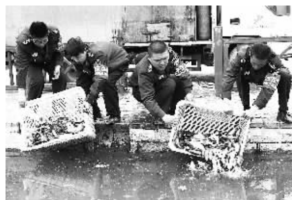
4月16日，北京奥林匹克公园，工作人员正放流鱼苗。北京市农业局今年计划人工放流滤食性、杂食性鱼苗1047.1万尾，观赏性鱼苗8万尾等。

据新华社北京4月16日电 国家安全生产监督管理总局16日在其官方网站发布通知，要求各地组织对烟花爆竹生产企业进行一次全面排查，严禁烟花爆竹生产企业使用甲醇代替乙醇进行亮珠制造、点尾药调湿等生产作业；对违规使用甲醇的，要依法严肃处理。通知称，此举旨在保护烟花爆竹生产作业人员健康。 甲醇是一种有毒危险化学品，易经胃肠道、呼吸道和皮肤吸收，对人体产生健康危害。记者从国家安全生产监督管理总局办公厅了解到，近年来，部分烟花爆竹生产企业用甲醇代替乙醇进行生产作业，由于职业卫生条件不达标、防护措施不到位，导致一些作业人员中毒甚至个别人员失明。