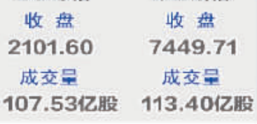
上证综指 收盘 2101.60 成交量 107.53亿股