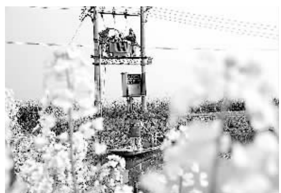
4月3日，国家电网兴化市供电公司共产党员服务队在江苏兴化市中镇田头检修配电设备。春耕时节，国家电网兴化市供电公司成立服务队小分队走进田间地头，为农民提供“零距离”的电力服务。