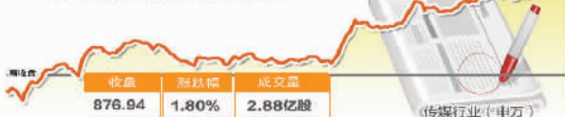
4月4日波动最大行业走势图