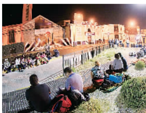
在智利阿里卡，人们在地震发生后坐在街上避险。中国地震台网正式测定：北京时间4月3日10时43分，在智利北部沿岸近海(北纬20.4度，西经70.1度)发生7.8级地震，震源深度20公里。

该项目建成后，将对天津生态城区域内的风能、太阳能光伏、地源热泵、太阳能热水等多种可再生能源利用及常规能源使用情况进行实时监测，并通过数据收集、追踪和分析，不断提升区域能源利用水平，促进区域能效优化，最终实现能源全生命周期管理和可持续应用。