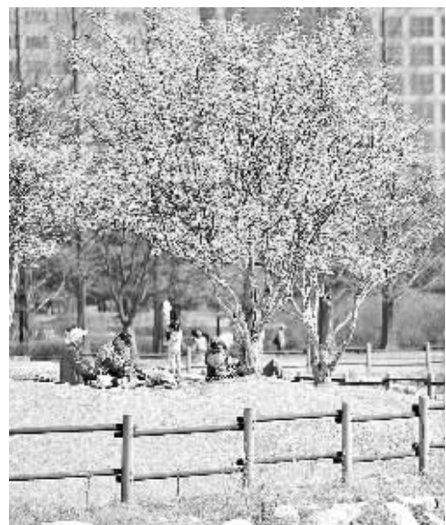
韩国今年入春较早,植物花期也较往年提前,人们争相在周末外出赏花踏青,享受春日的明媚阳光。图为韩国京畿道湖水公园一角。

本报讯 记者陈颀报道:乐高集团日前透露,乐高全球区域总部将在上海建成,乐高嘉兴工厂的建设也已拉开序幕,预计于2016年投入使用,以供应日益增长的亚洲市场需求。在全球玩具市场持续低迷的背景下,乐高集团全年销售额增长11%,在中国市场更取得50%以上的强劲增长。据悉,乐高集团将继续重点开发受儿童青睐的新产品。