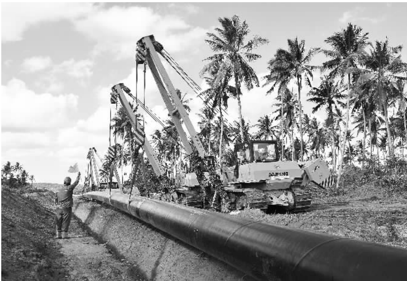
在距离坦桑尼亚达累斯萨拉姆30公里的姆库兰加镇拍摄的陆上干线管道施工现场。由中国进出口银行向坦桑尼亚政府提供贷款,中国石油承建的坦桑尼亚天然气综合利用项目,主体工程由一条全长542公里的输气管道和两座天然气处理厂组成。截至2014年3月30日,该工程陆上管道建设工程量已完成50%,海底管道完成85%;两座天然气处理厂工程建设顺利推进。

为渡过消费税增税的难关,日本政府已经准备了应对举措,日本央行也不断放出风声,将根据经济形势的变化随时推出新的量化宽松政策。年初以来,一些大企业在政府的压力下,不得不小幅度提高了职工工资。此举意在促进个人消费,避免消费市场萎缩。但是,日本经济专家普遍认为,政府的经济对策效果有限,央行新的量宽措施几乎没有余地,职工工资涨幅很小,三者对经济的拉动力不能高估。正如日本媒体最近发出的警告:“安倍内阁面临最严峻的考验,消费税可能将日本经济拉入低谷”。