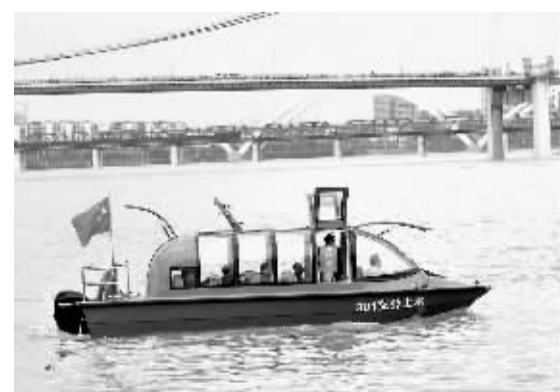
3月31日，在广西柳州市的柳江河面上，市民乘坐“水上公交巴士”出行。当日，广西柳州“水上公交巴士”正式开通。