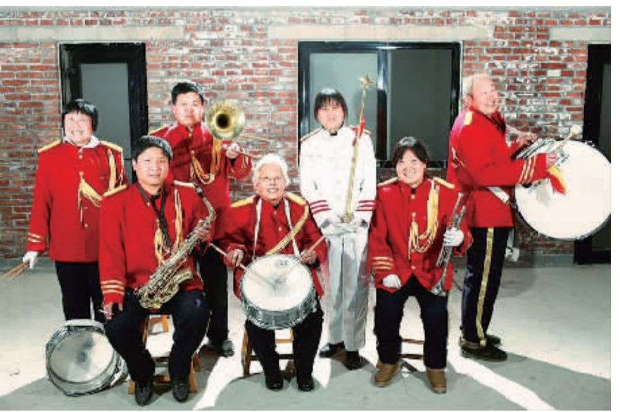
周窝村的老年交响乐团 (资料图片)