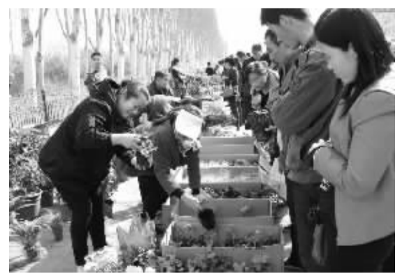
随着天气回暖,内蒙古自治区开鲁县花卉市场开始热闹起来。随着生活水平的提高,农村消费成为当地今年花卉消费市场的亮点。

据统计,东莞为全国网络销售提供了近3成的货源,产品种类达6万多种,涉及20多个行业,发货数量排名全国第二。2012年,东莞提供电子商务服务的企业约2000家,应用电子商务的企业超过2万家,物流服务企业300多家,支付及信用服务企业100多家。全市173个专业市场中,已有近60%开展了电子商务。