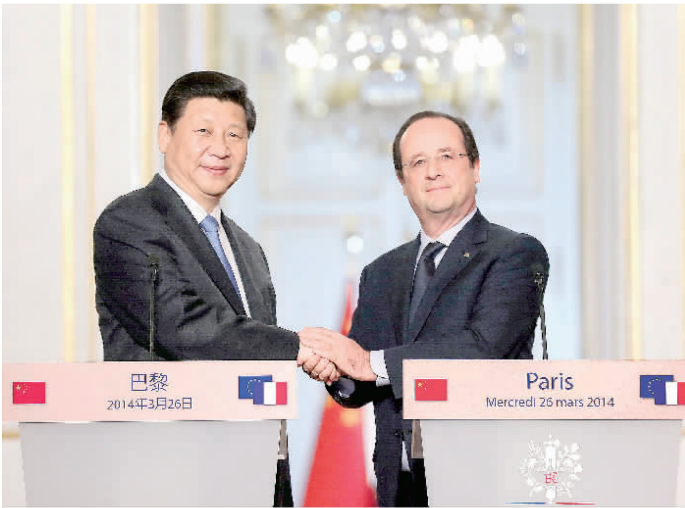
3月26日,国家主席习近平在巴黎与法国总统奥朗德共同会见记者。

奥朗德表示,值此法中两国隆重庆祝建交50周年之际,法国最热烈地欢迎习近平主席对法国进行国事访问。相信