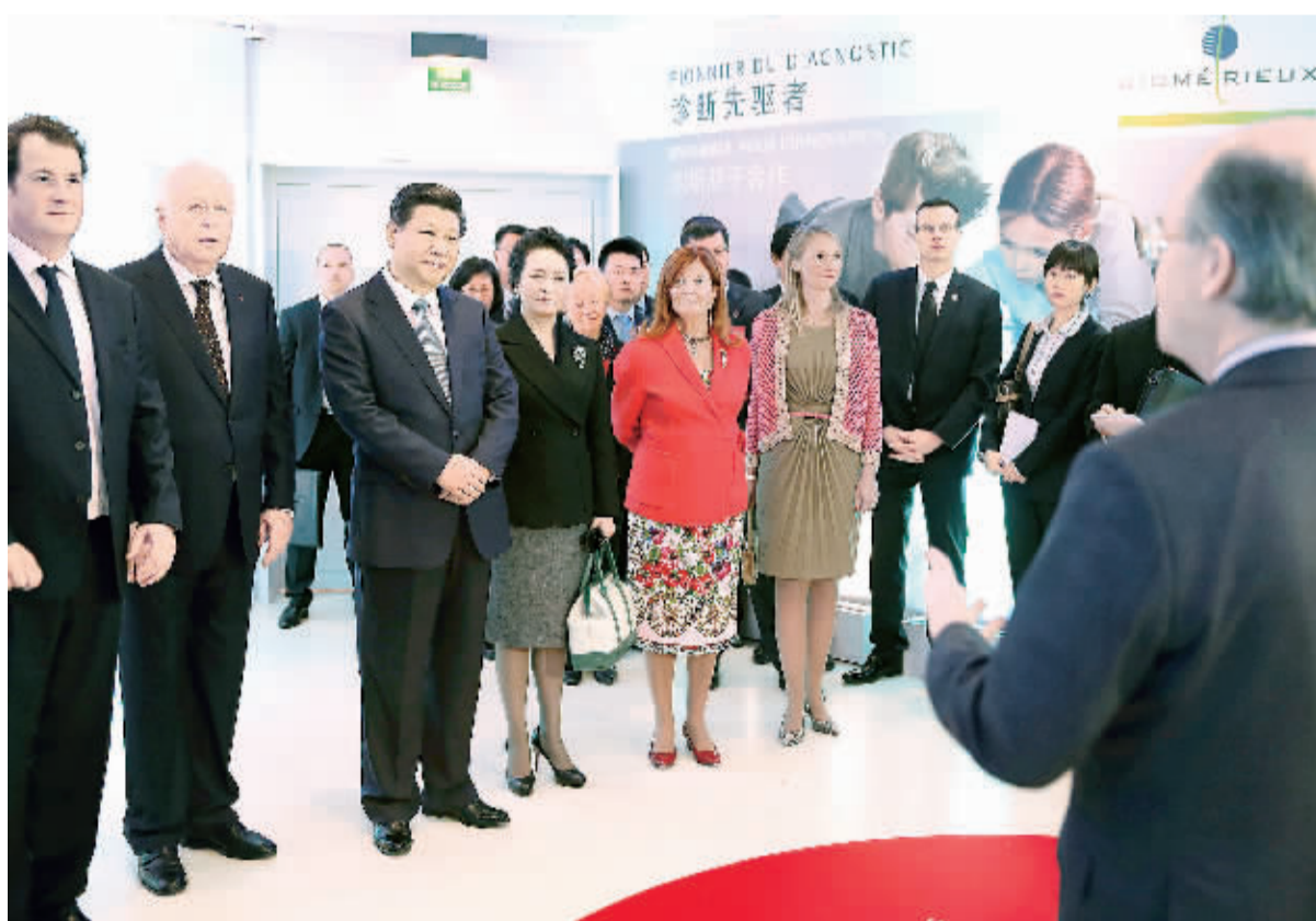
3月26日，国家主席习近平在法国里昂参观梅里埃生物研究中心。这是习近平和夫人彭丽媛听取介绍。