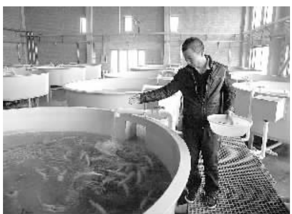
3月25日，北京通州区金福鱼汇工厂化养殖基地的工人正在喂鱼，该基地为全封闭工厂化循环水养殖高产高效生产基地。为丰富市民“菜篮子”，北京市农业局大力发展渔业工厂化循环水养殖，建设高产高效生产基地。

本报北京3月25日讯 记者冯其予从国家食品药品监督管理局获悉：脉搏传感器标准提案近日顺利通过ISO/TC249公开投票，正式成为ISO国际标准项目，标准号ISO19614。 该提案成功立项，是我国医疗器械标准化组织牵头主导国际标准制定的开端，也是中国医疗器械标准国际化的重要里程碑，将有利于积极组织和整合相关中医学领域资源，充分发挥我国在中医诊疗设备上的传统优势，逐步将电子治疗仪等已有国内标准提升为国际标准，为全球中医诊疗设备的生产、贸易、监管等服务。该立项获得加拿大、澳大利亚、美国、泰国、南非等绝大部分成员国与会专家的支持，提案直接进入ISO公开投票程序。