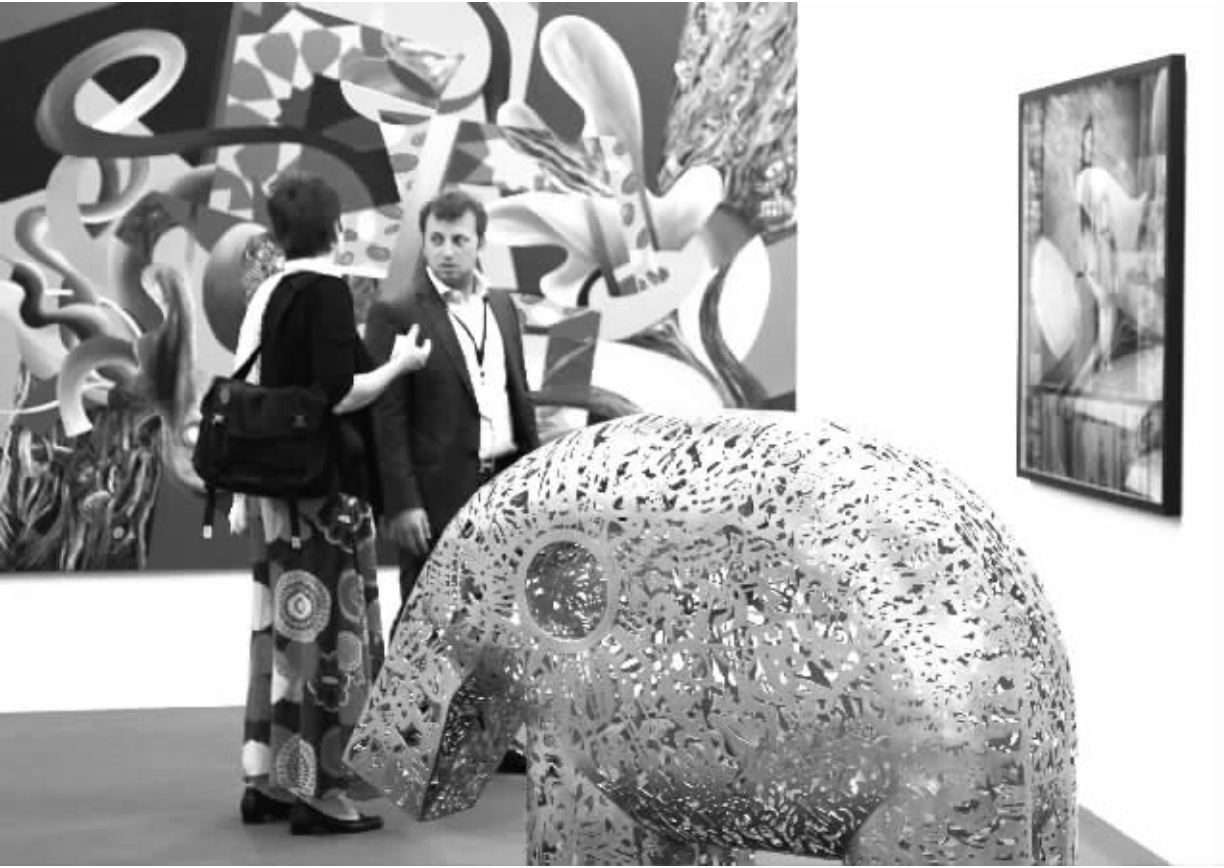
在阿拉伯联合酋长国的迪拜艺术展上，观众在欣赏作品。第八届迪拜艺术展日前在与迪拜“帆船酒店”毗邻的朱迈拉水城开幕。展览由当代艺术馆、现代艺术馆和艺术空间主题展三部分组成，共吸引来自34个国家和地区的85家画廊、超过500位艺术家参展。