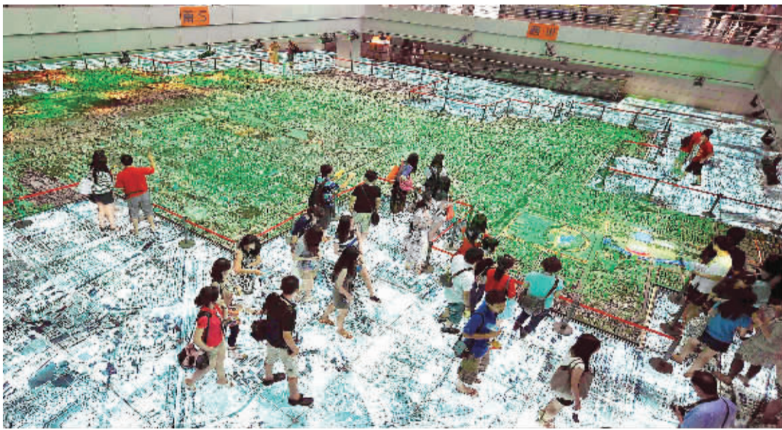
观众在北京市规划展览馆参观城市模型。

按照国家新型城镇化规划提出的“严格控制特大城市人口规模”要求，北京市出台“以业控人”、启动低端产业转移外迁等措施，今年将重点启动中心城小商品交易市场整治和外迁工作，带动人口的分流。