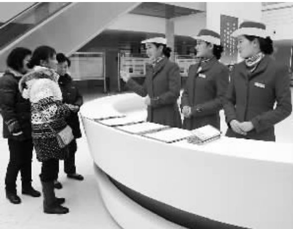
为满足患者就诊需求，更好地提供医院服务，湖北省公安县人民医院成立“天使服务中心”专职导诊队伍。图为导诊护士统一着装，引领患者就诊。

本报讯 记者乔金亮报道：农业部日前召开全国春季重大动物疫病防控工作视频会议，宣布全面启动春季集中免疫工作，力争5月上旬全部完成，5月中旬开展免疫效果评价。同时，积极探索强制免疫财政补助政策改革试点工作。 农业部副部长于康震表示，今年动物疫病防控面临近年来少有的严峻局面，国内动物疫情复杂，疫情发生风险较高，全球特别是周边国家和地区疫情呈高发态势，对我国防控威胁持续加大。同时，生猪价格持续下跌，牛羊肉价格持续走高，受H7N9影响家禽业发展遭遇巨大困难，都对动物疫病防控提出了更高要求。