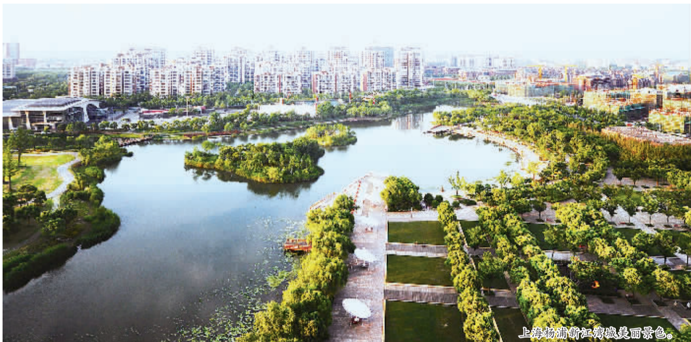
上海杨浦新江湾城美丽景色。

居民一方面拍手称快,另一方面也不无担忧:“反复整治—反复回潮”是城市管理顽疾的集中表现,万一这次治理之后,再次“旧貌重回”怎么办?就此,大桥街道相关负责人也表态:为了避免集中整治后出现“回潮”现象,街道将注重长效机制的建立和常态化管理:规范划线经营,规范商家在线内经营及停车,让出“生命通道”;强化日常执法巡查,街道居委会派出志愿者进行日常巡逻,执法部门派出专人固守并加强执法力度,另外,市民督查队也会不定期进行督查。