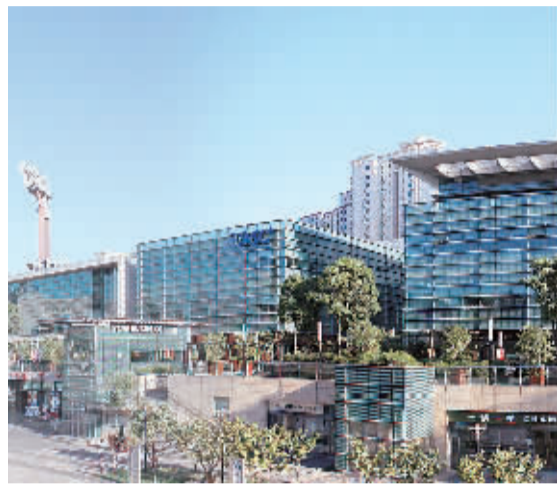
上海杨浦区创智天地全景。