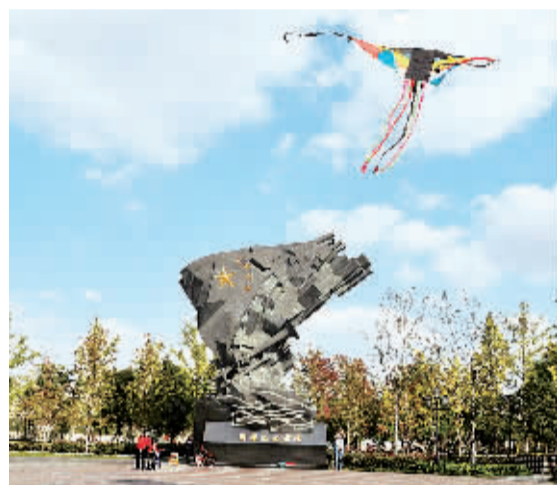
上海杨浦区国歌纪念广场一角。