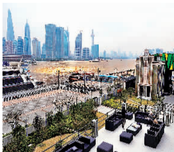
上海杨浦区滨江发展带一角。