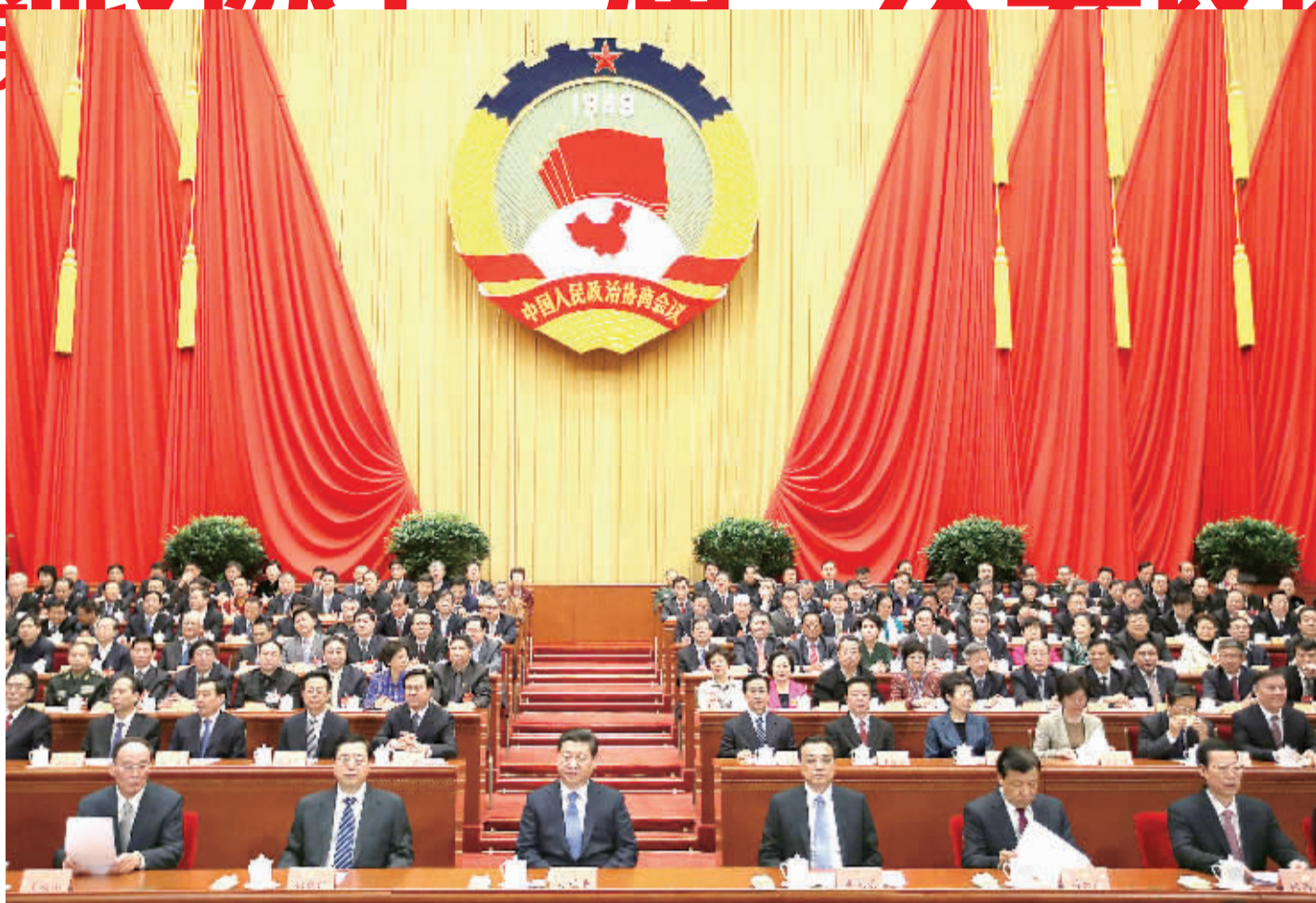
3月12日,中国人民政治协商会议第十二届全国委员会第二次会议在北京闭幕。这是习近平、李克强、张德江、刘云山、王岐山、张高丽等在主席台就座。

据新华社北京3月12日电 13日上午9时,第十二届全国人民代表大会第二次会议在人民大会堂举行闭幕会,表决关于政府工作报告、关于2013年国民经济和社会发展计划执行情况与2014年国民经济和社会发展计划、关于2013年中央和地方预算执行情况与2014年中央和地方预算、关于全国人民代表大会常务委员会工作报告、关于最高人民法院工作报告、关于最高人民检察院工作报告的6个决议草案;表决关于确认全国人大常委会接受王晓、陈斯喜辞去全国人大常委会委员职务的请求的决定草案。